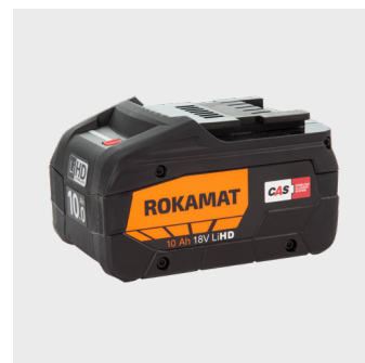
107080 - Batteri - 18V / 10.0 Ah Li-ion