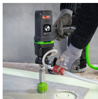
Kan også anvendes håndholdt, uden stander